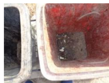
绿湖村大新 528 号垃圾分类正常