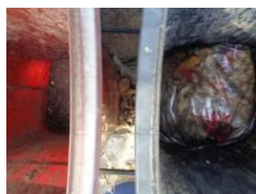
华星村海桥 1004 号垃圾干湿不分