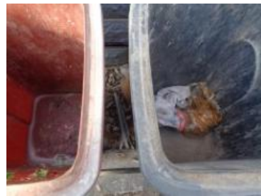
华星村海桥 1005 号垃圾分类正常