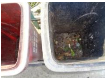
绿湖村大新 549 号垃圾分类正常