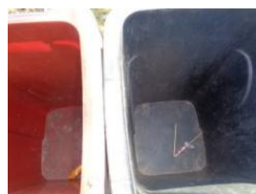
华荣村建城 113 号垃圾分类正常