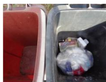
华西村江口 509 号垃圾分类正常