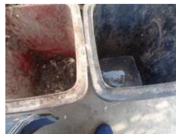
绿湖村大新 412 号垃圾分类正常