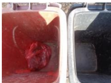
绿园村建三 1012 号垃圾干湿不分