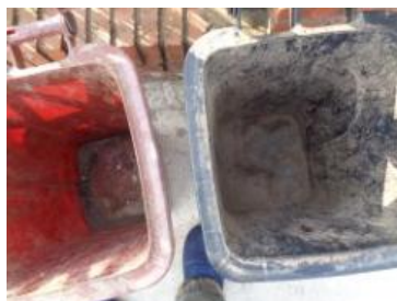
绿港村堡镇 232 号垃圾分类正常