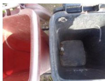
华西村江口 512 号垃圾分类正常