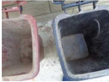
绿港村堡镇 230 号垃圾分类正常