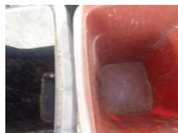
华西村江口 517 号垃圾分类正常