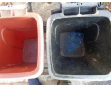
海华新村 54 号垃圾分类正常