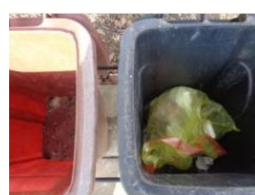
华荣村建城 134 号垃圾分类正常