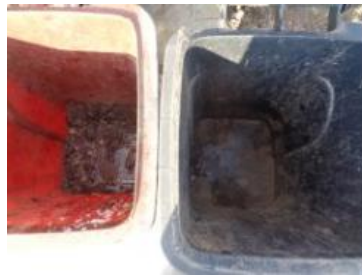
绿湖村大新 518 号垃圾分类正常