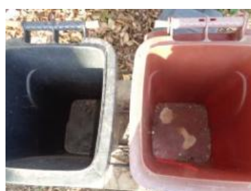
华荣村建城 115 号垃圾分类正常