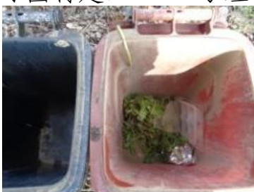
绿园村建三 1104 号垃圾干湿不分