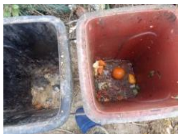
绿湖村大新 503 号垃圾分类正常