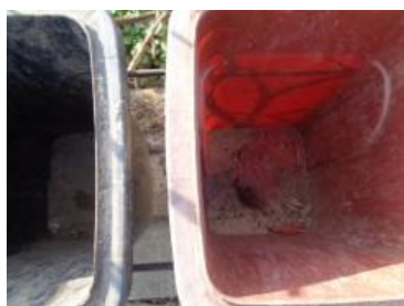
华荣村建城 109 号垃圾分类正常