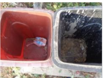
绿港村堡镇 408 号垃圾干湿不分