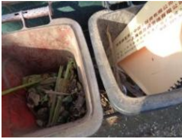
华星村海桥 1003 号垃圾分类正常