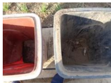
绿湖村大新 413 号垃圾分类正常