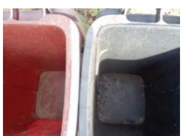
绿园村建三 1010 号垃圾分类正常