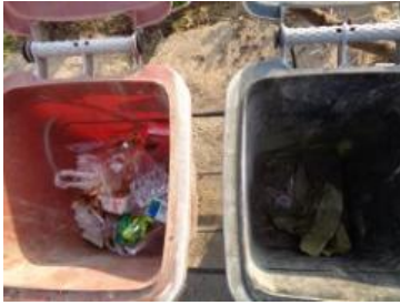
海华新村 41 号垃圾干湿不分