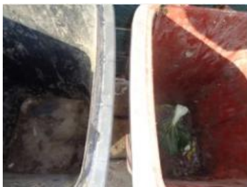
华星村海桥 1010 号垃圾分类正常