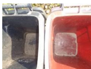
华西村江口 510 号垃圾分类正常