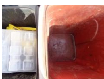
华西村江口 508 号垃圾分类正常