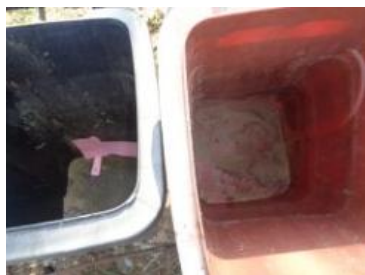
华荣村建城 106 号垃圾分类正常