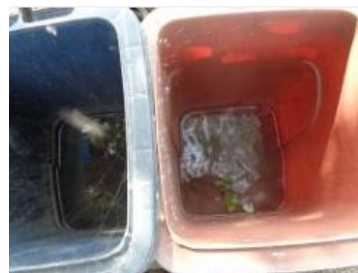
绿园村建三 1106 号垃圾分类正常