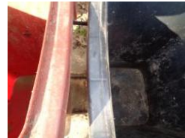
华星村海桥 1009 号垃圾分类正常