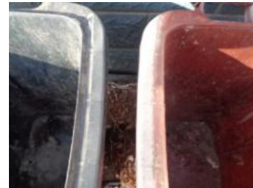
华星村海桥 1007 号垃圾分类正常