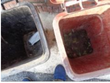
绿港村堡镇 219 号垃圾分类正常