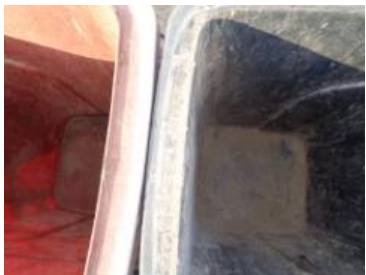
绿湖村大新 504 号垃圾分类正常