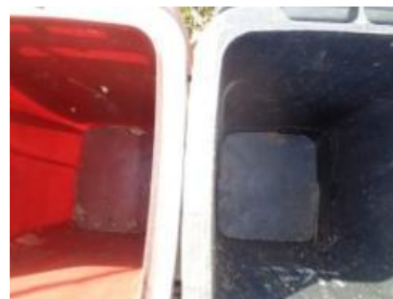
华西村江口 514 号垃圾分类正常