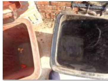
绿港村堡镇 229 号垃圾分类正常