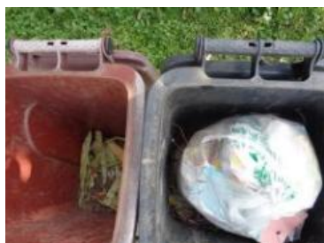
华西村江口 515 号垃圾分类正常