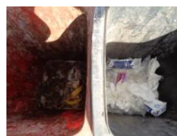
绿园村建三 1013 号垃圾分类正常