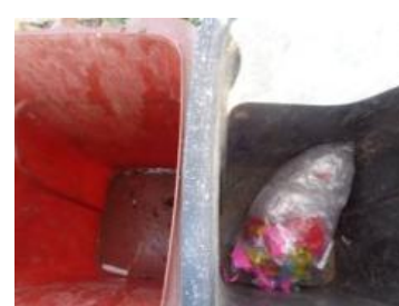
绿园村建三 1015 号垃圾分类正常