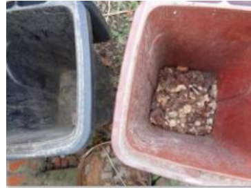
绿港村堡镇 221 号垃圾分类正常