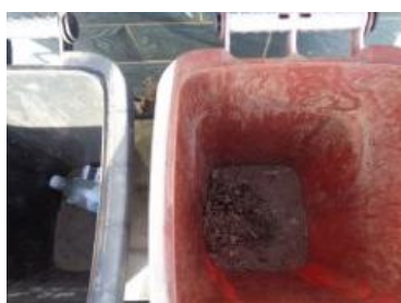
华西村江口 513 号垃圾分类正常