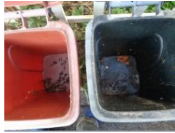
海华小区 57 号垃圾分类正常