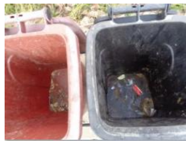
绿港村堡镇 409 号垃圾分类正常