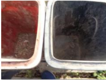
华星村海桥 1006 号垃圾分类正常