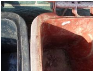
华星村海桥 1008 号垃圾分类正常