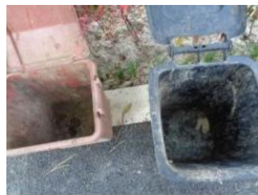
绿港村堡镇 222 号垃圾分类正常