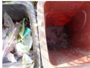
华荣村建城 108 号垃圾分类正常