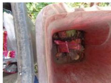
华荣村建城 107 号垃圾干湿不分