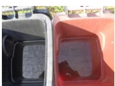
绿园村建三 1014 号垃圾分类正常