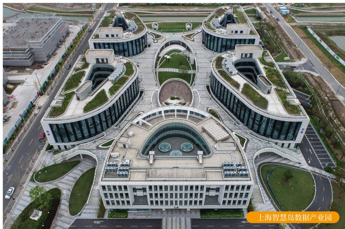
上海智慧岛数据产业园