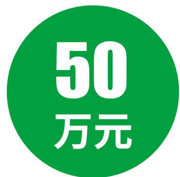
崇明区区长质量奖

对质量管理水平卓越、自主创新能力显著、品牌知名度高、创新性和示范性、经济效益和社会效益处于本区和全市同行业内领先地位的组织，颁发奖牌、证书和奖金50万元。