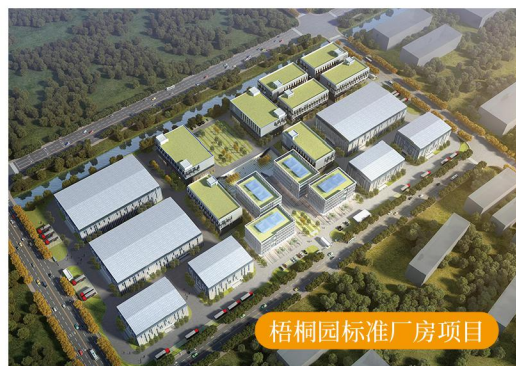
梧桐园标准厂房项目