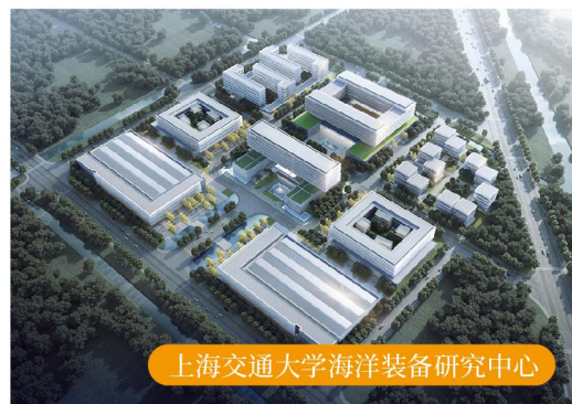
上海交通大学海洋装备研究中心