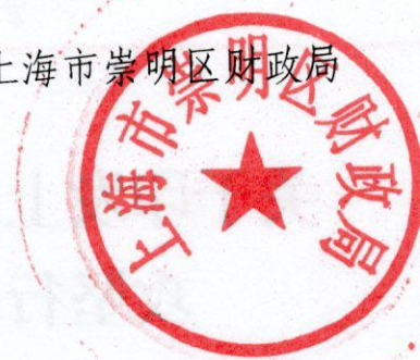
上海市崇明区财政局