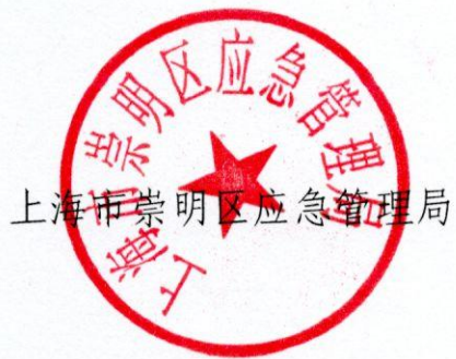
上海市崇明区应急管理局