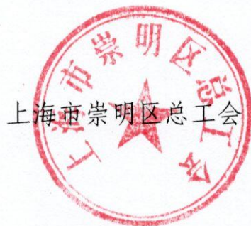
上海市崇明区总工会