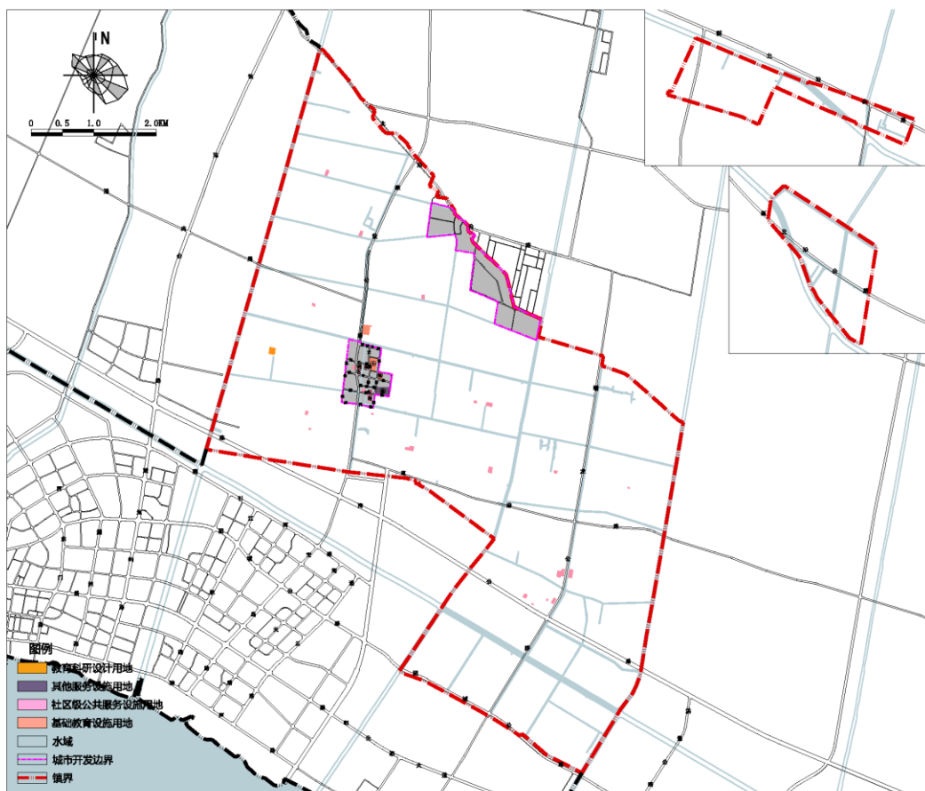
公共服务设施规划图